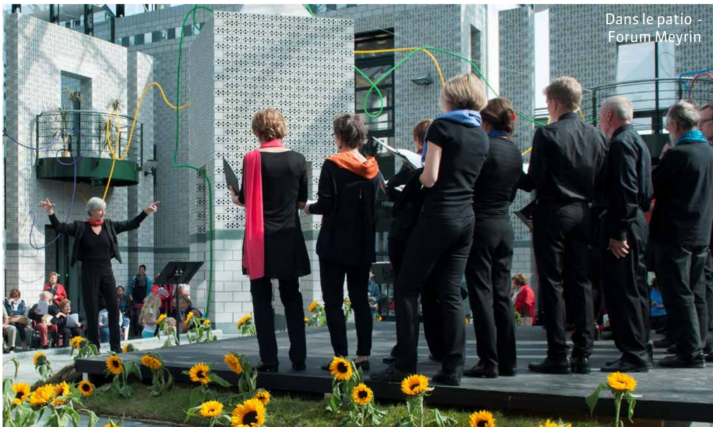
Dans le patio - Forum Meyrin