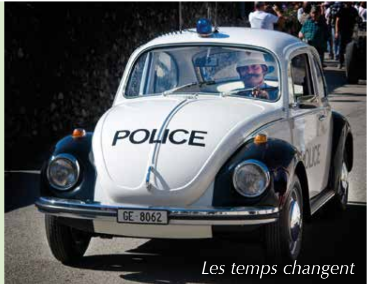
Les temps changent

Une seule ombre au tableau : Il est regrettable que dans le budget 2015, la droite meyrinoise (MCG, PDC, PLR et UDC) ait refusé une légère augmentation des effectifs qui aurait permis à la Commune de mieux accomplir les nombreuses missions de service public que la population attend d'elle. Toujours aux premières loges quand il s'agit de dénoncer l'insécurité, la droite a notamment refusé un poste administratif à 50% à la Police municipale qui devait pourtant alléger les tâches administratives des agents et ainsi renforcer leur présence sur le territoire. Allez comprendre !